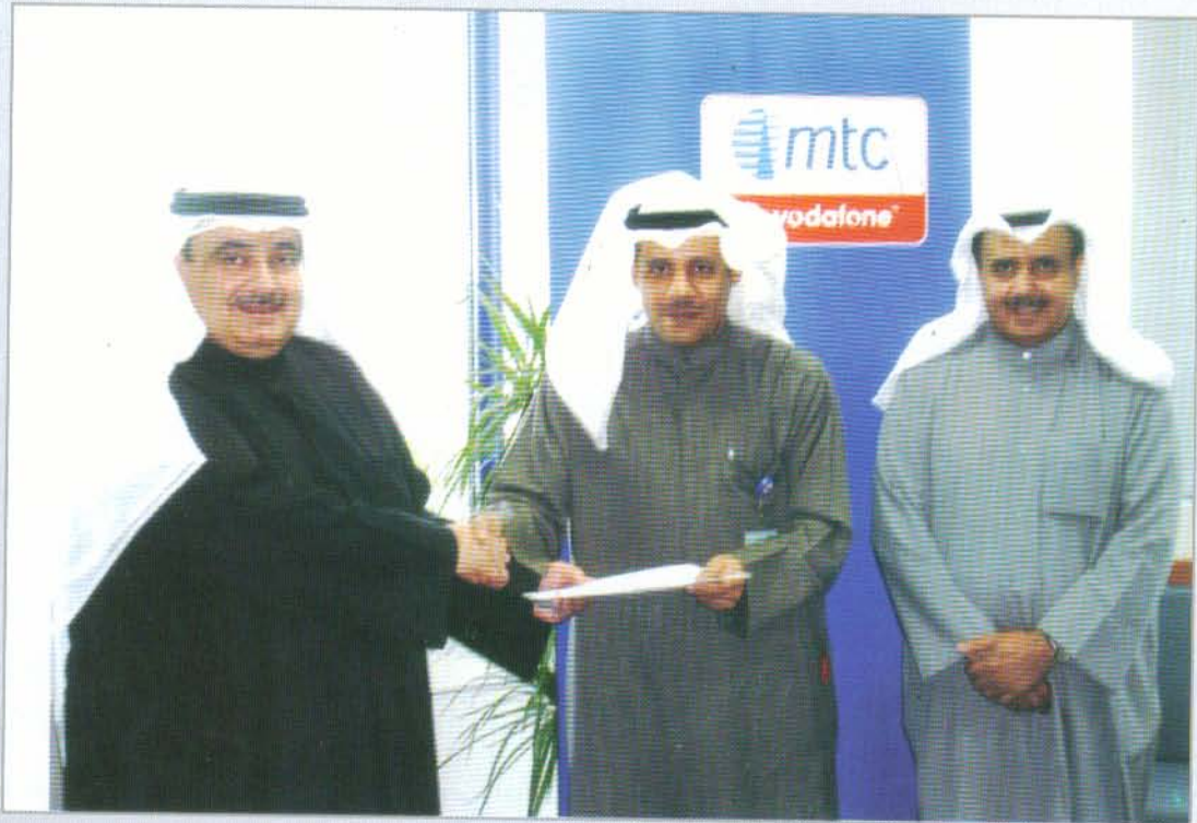
رئيس مجلس إدارة الجمعية يتسلم عقد الاتفاق من المدير التنفيذي للمبيعات بشركة mtc بحضور نائب رئيس مجلس إدارة الجمعية

انطلاقاً من سعي الجمعية لتحقيق المزيد من المزايا التجارية لأعضاء الجمعية، فقد توجت تلك المساعي مؤخراً بالتوصل إلى إبرام عقد اتفاق بين الجمعية وشركة الاتصالات المتنقلة mtc يتضمن منح مزايا وخصومات خاصة لأعضاء الجمعية اشتملت على توفير بعض الخدمات بصفة مجانية واحتساب تكلفة مخفضة لسعر الوحدة مع السماح للعضو الحصول على خمسة خطوط بتلك المزايا والخصومات.