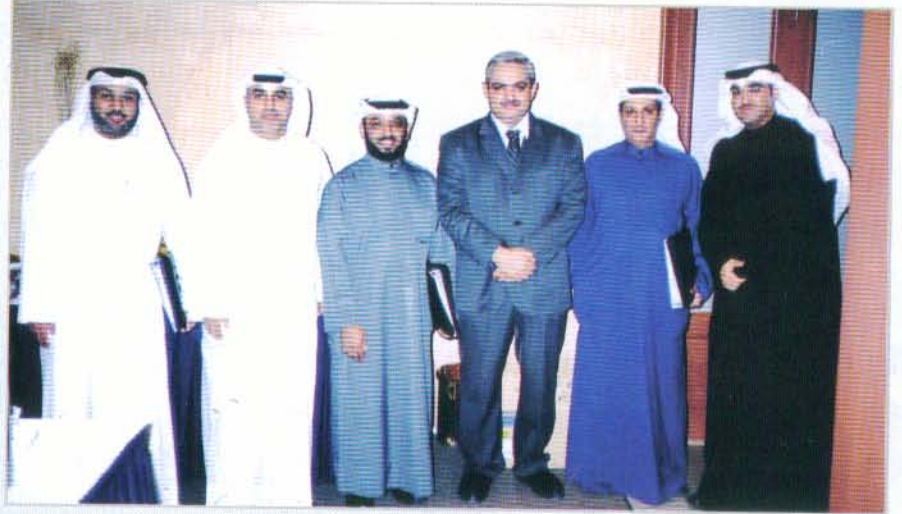
فريق الأنشطة التدريبية

وجدير بالذكر بأن الجمعية حريصة على عقد تلك اللقاءات العلمية والمهنية خدمة لاعضاءها والمهتمين بالمهنة والقائمين عليها.