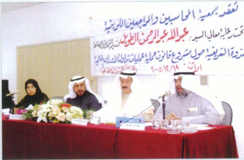
المحاضرون في الندوة التعريفية حول مشروع قانون حماية عمليات تداول الأوراق المالية

شدد النائب عبدالوهاب الهارون على أهمية اقرار القانون الخاصة بحماية تداول الاوراق المالية في البورصة، بما يستهدف تعديل الاطار التشريعي الحاكم لسوق رأس المال تعديلاً جذرياً من خلال وضع تشريع جديد شامل يحل محل التشريعات الراهنة وهي مجموعة من التشريعات العديدة والمتفرقة، ويأخذ في الحسبان التطورات الحديثة التي شهدتها اسواق رأس المال في دول العالم المختلفة مع الاسترشاد بالمعايير الدولية التي وصفها اتحاد البورصات العالمية مع تلافي جميع السلبيات