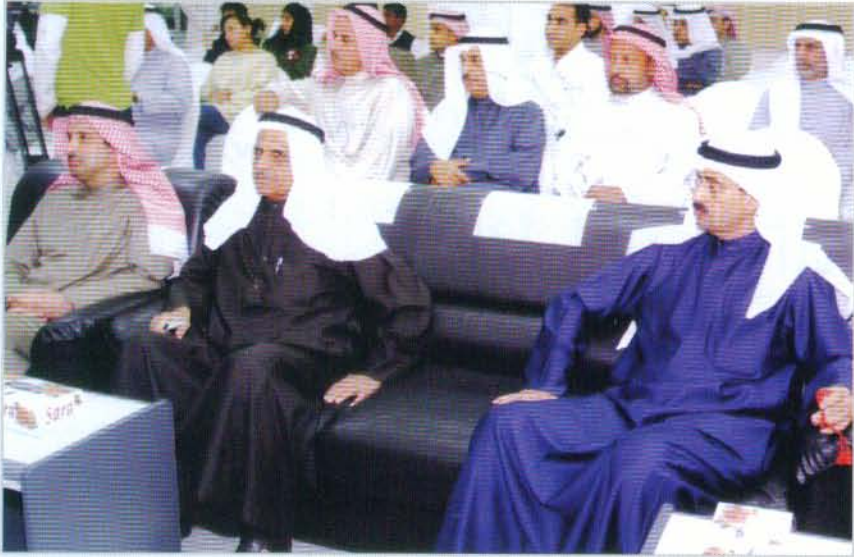
الندوة التعريفية حول مشروع قانون حماية عمليات تداول الأوراق المالية

والضوابط التي تكفل الانضباطية والشفافية للمتعاملين في السوق، الا انه من الملاحظ ان اجراءات وسياسات الاصلاح التي تم تنفيذها حتى الآن قد اخذت باسلوب المعالجات الجزئية على مراحل والتي وان كانت في الاتجاه الصحيح لكنها بطيئة الحركة كما انها لا تتسم بالشمولية والهيكلية رغم وضوح اوجه القصور والنقائص التي يعاني منها سوق الكويت للاوراق المالية والتي اوضحها تقرير بعثة العمل المشتركة لصندوق النقد والبنك الدوليين حول تقييم النظام المصرفي والمالي لدولة