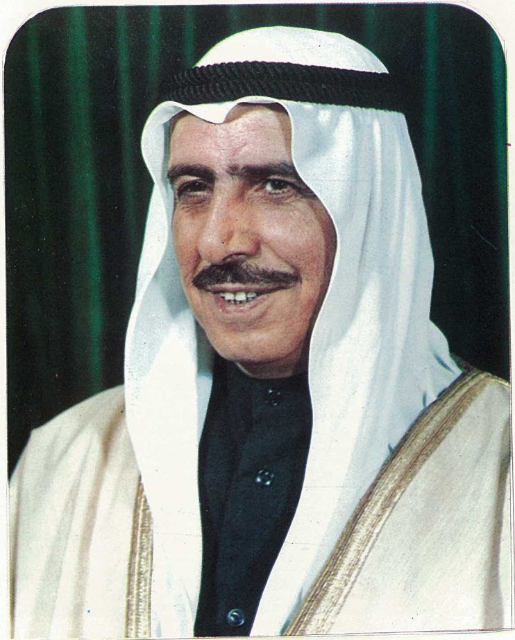
حضرة صاحب السمو الشيخ صباح السالم الصباح أمير دولة الكويت العظم