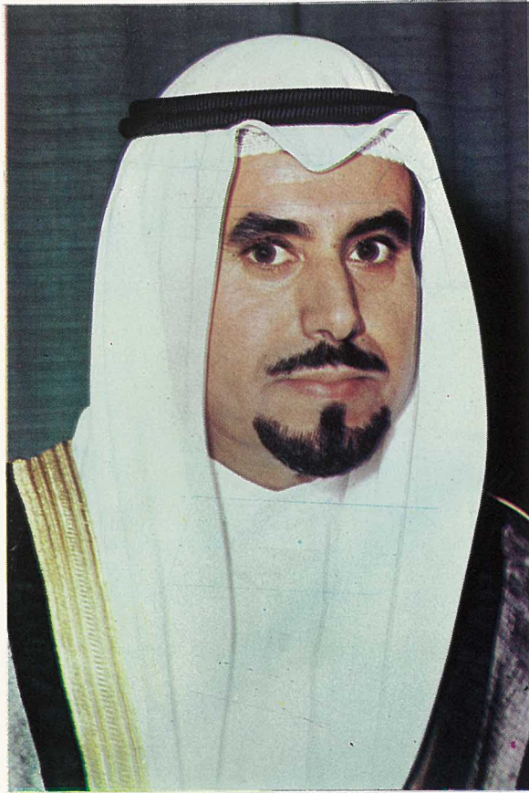
حضرة صاحب السمو الشيخ جابر الأحمد الصباح وزير الشؤون الخارجية والتمهيد وتنسيق مجلس الوزراء العظم