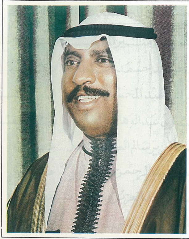
سَمُو الشَّيْخِ سَعْدِ الْعَبْدِ اللَّهِ السَّالِمِ الصَّبَّاحِ وَلِيِّ الْمَهْدِ وَرئيسِ مَجْلِسِ الْوُزَرَاءِ