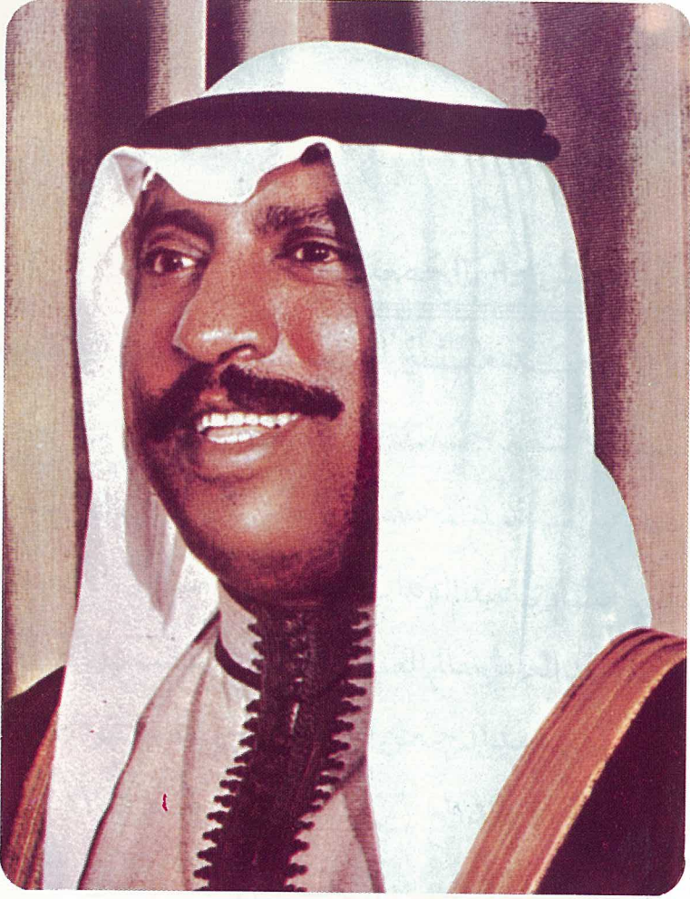
سَمُو الشَّيْخِ سَعْدِ الْعَبْدِ اللَّهِ السَّالِحِ الصَّبَّاحِ وَلِيِّ الْمَهْدِ وَرئيسِ مَجْلِسِ الْوُزَرَاءِ