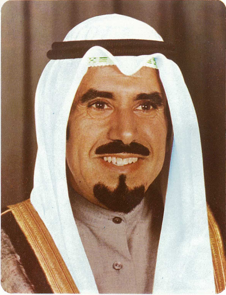
صاحب السمو الشيخ جابر الأحمد الجابر الصباح أمير دولة الكويت