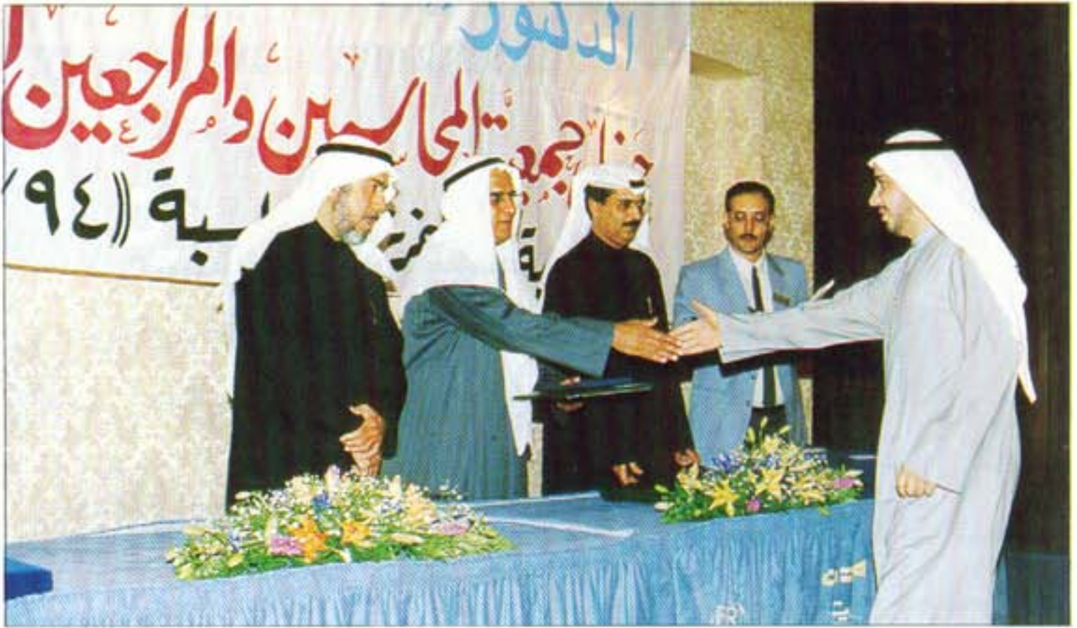
من حفل تكريم خريجي المحاسبة ٩٤ / ٩٥