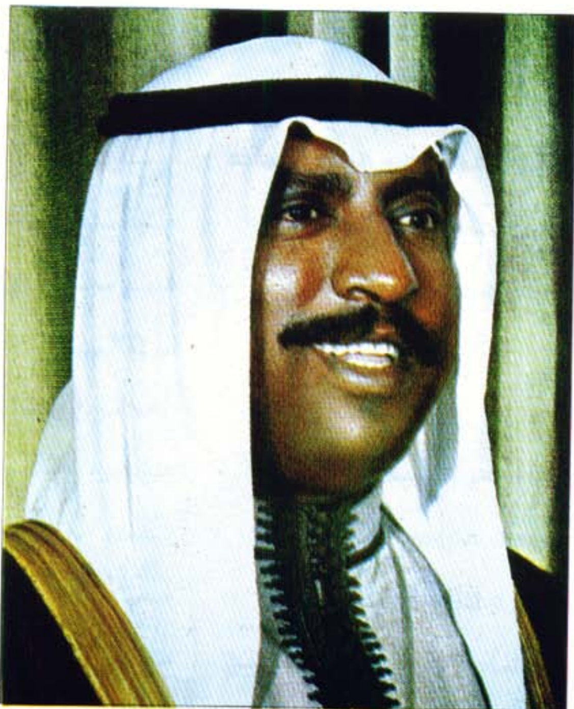
حضرة صاحب السمو الشيخ سعد العبدالله السالم الصباح ولي العهد ورئيس مجلس الوزراء