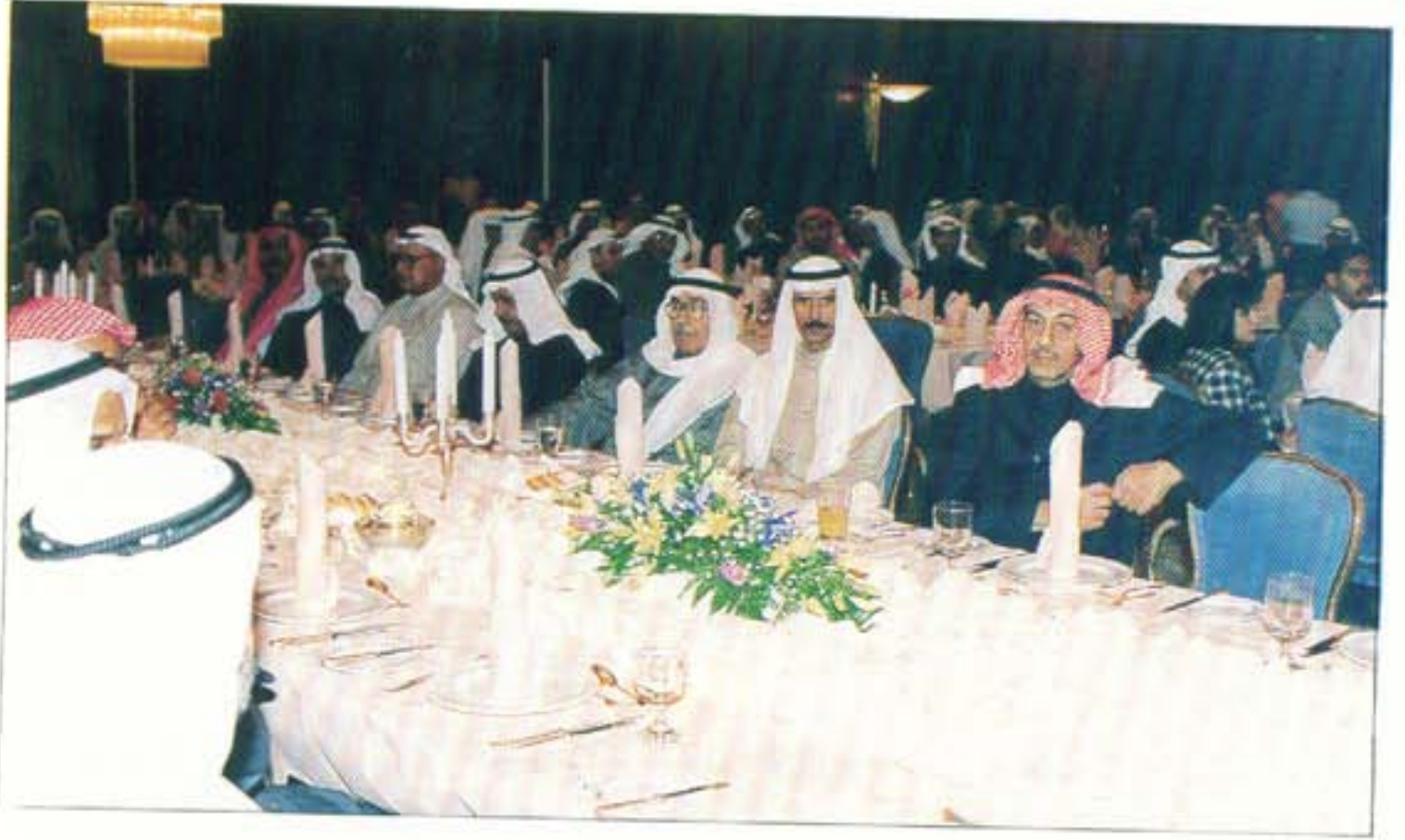
من حفل تكريم خريجي المحاسبة ٩٤ / ٩٥