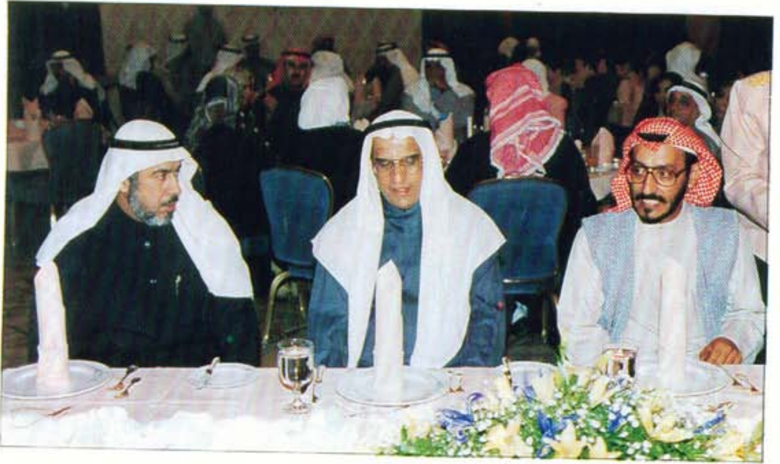
من حفل تكريم خريجي المحاسبة ٩٤ / ٩٥