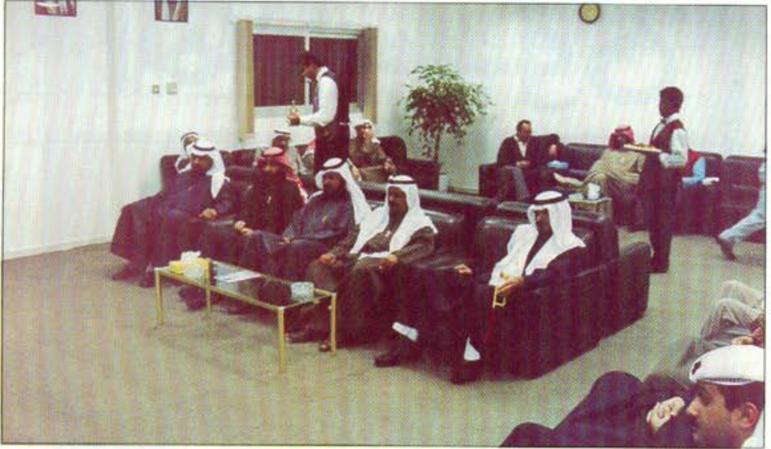
من حفل غذاء العيد

يتم بصفة مستمرة الاحتفال بعيد الفطر وعيد الأضحى المبارك وذلك بدعوة جميع أعضاء الجمعية لمأدبة غذاء تقام ثاني أيام العيد .