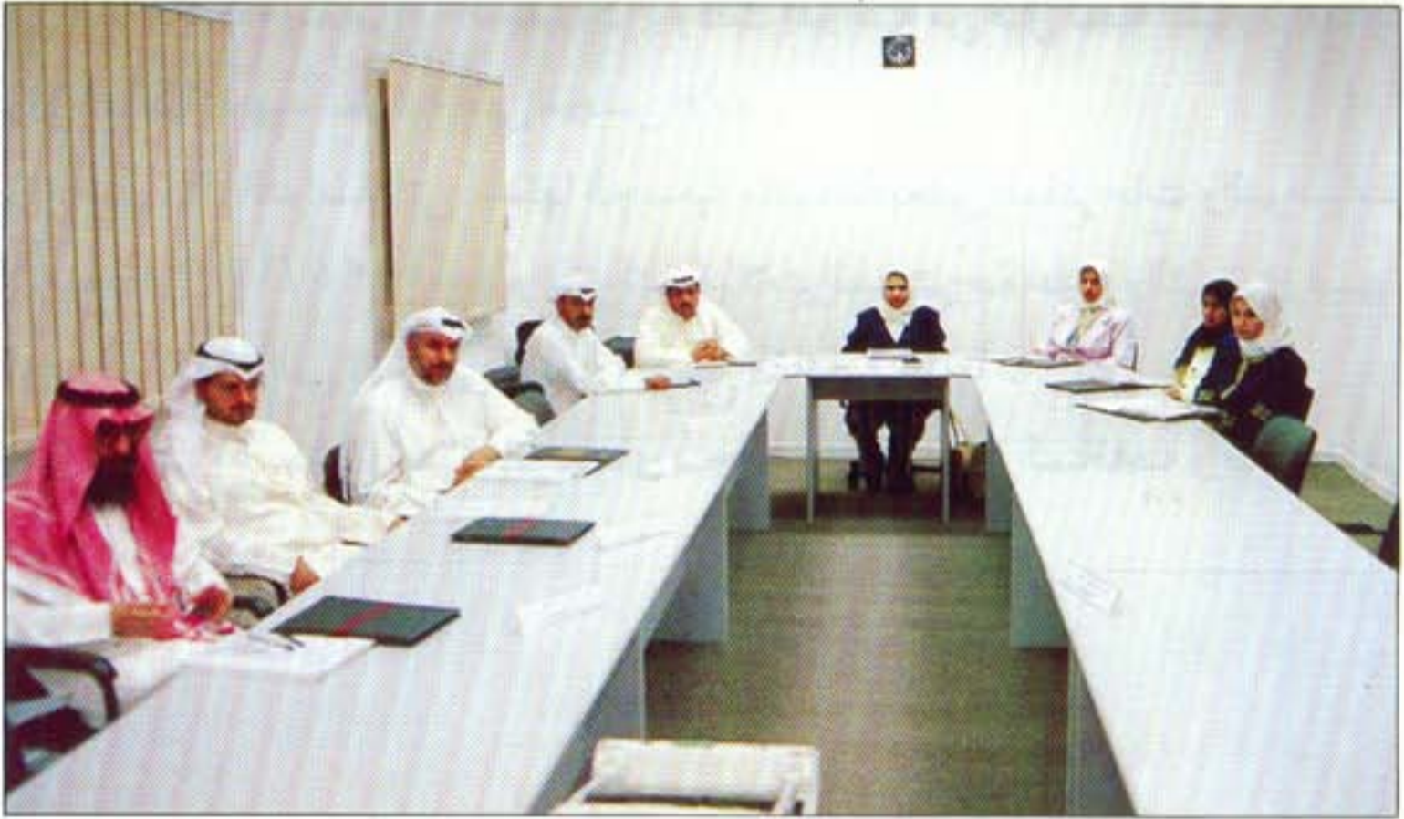
إحدى الدورات التدريبية

تم بتاريخ ٢٧ / ١٢ / ١٩٩٥ اختتام الدورات التدريبية الخاصة بالجزء الأول من الموسم التدريبي ٩٥ / ٩٦ والتي تضمنت خمسة دورات هي :