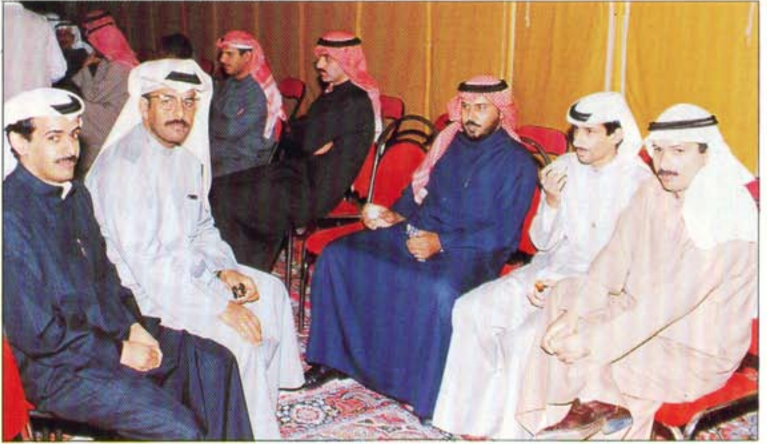
حفل الغبقة الرمضانية

تم يوم الاثنين الموافق ١٩٩٦/٢/٥ ، إقامة حفل الغبقة الرمضانية حسب المعتاد في شهر رمضان من كل عام ، حيث حضرها عدد كبير من أعضاء الجمعية ، وتعتبر هذه الحفلات من إثراءات الأنشطة الاجتماعية الهامة للجمعية .