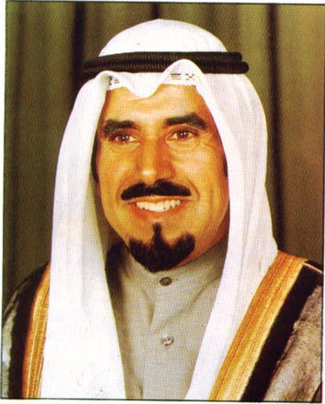
حضرة صاحب السمو أمير البلاد الشيخ جابر الأحمد الجابر الصباح أمير دولة الكويت