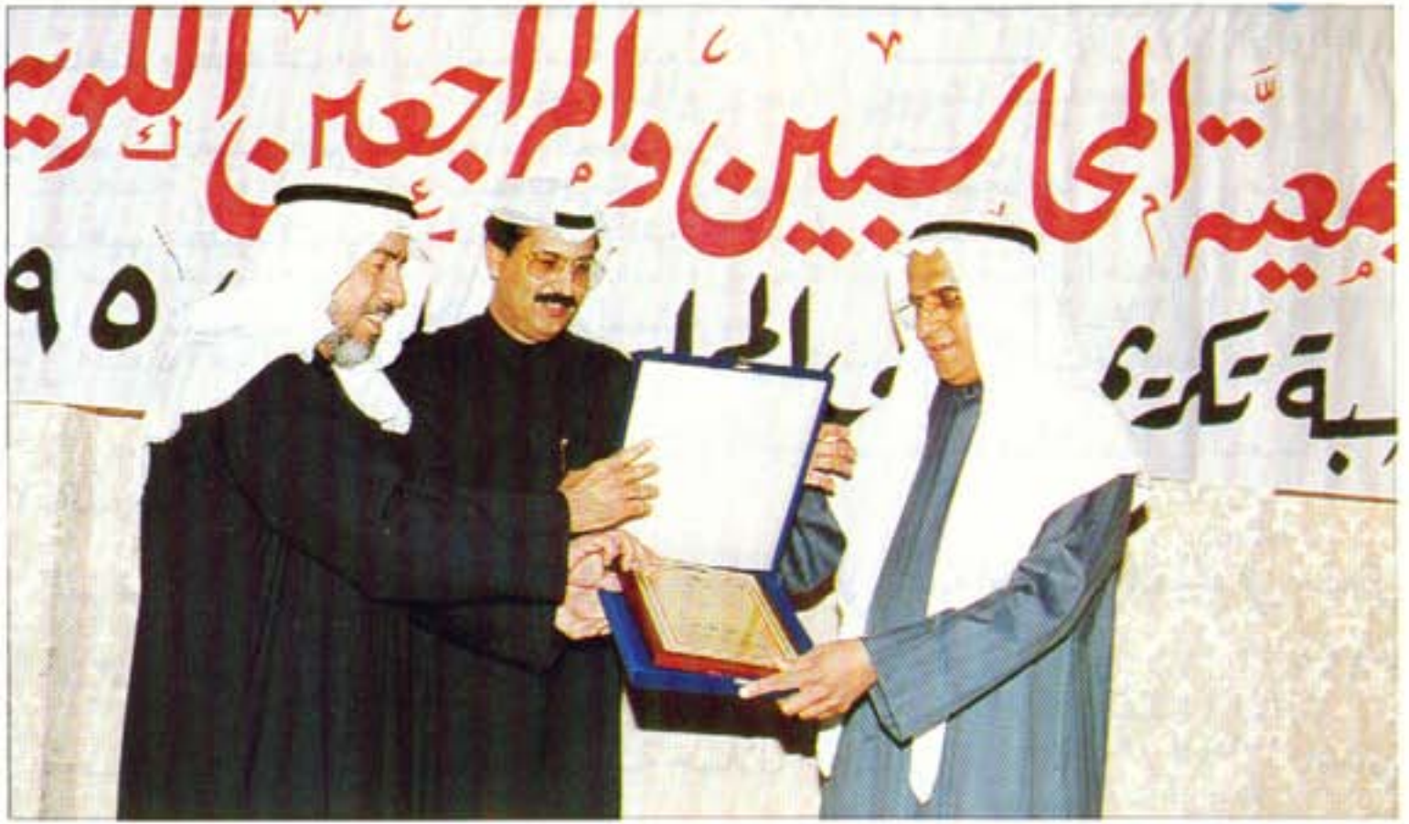
من حفل تكريم خريجي المحاسبة ٩٤ / ٩٥