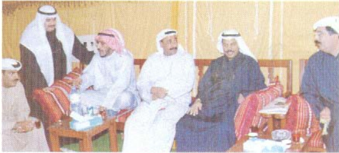
جانب من الحضور في حفل الغبقة الرمضانية.

جريا على عاداتها من كل عام اقامت اللجنة الثقافية والاجتماعية حفل الغبقة الرمضانية وذلك يوم الاثنين الموافق ١٢ / ١ / ١٩٩٨ ، حيث حضر هذا الحفل عددا من أعضاء الجمعية .