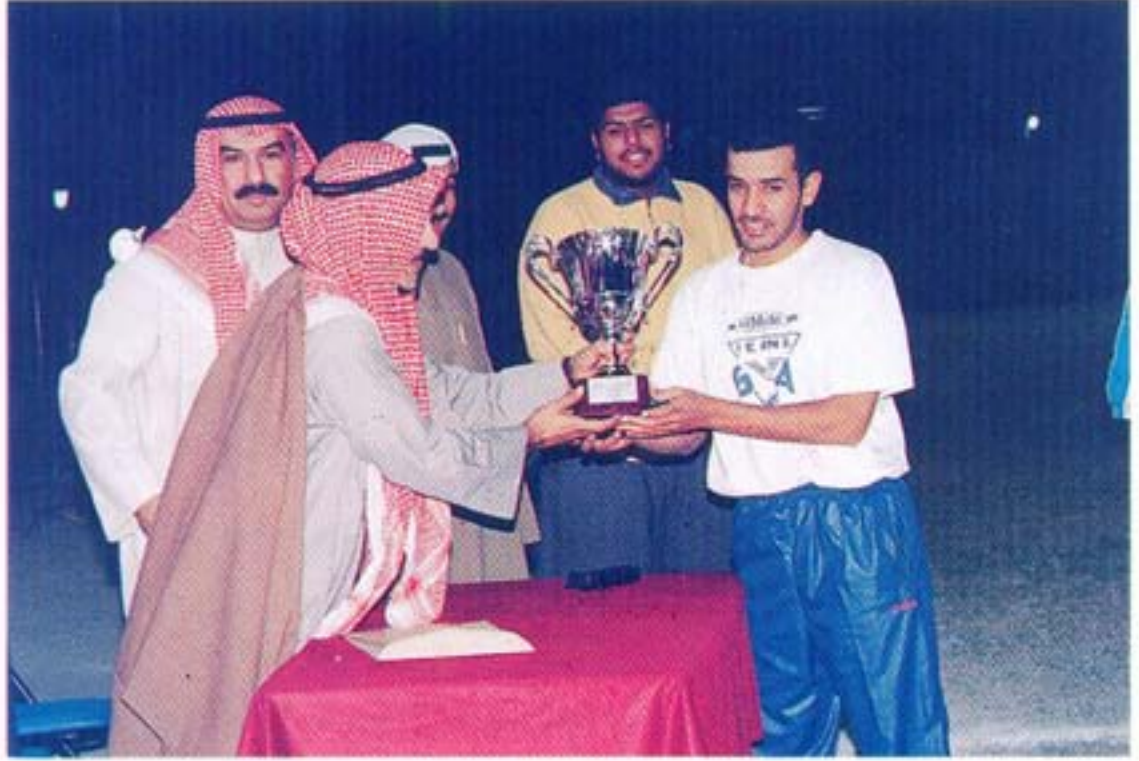
● الدورة الرمضانية في كرة القدم