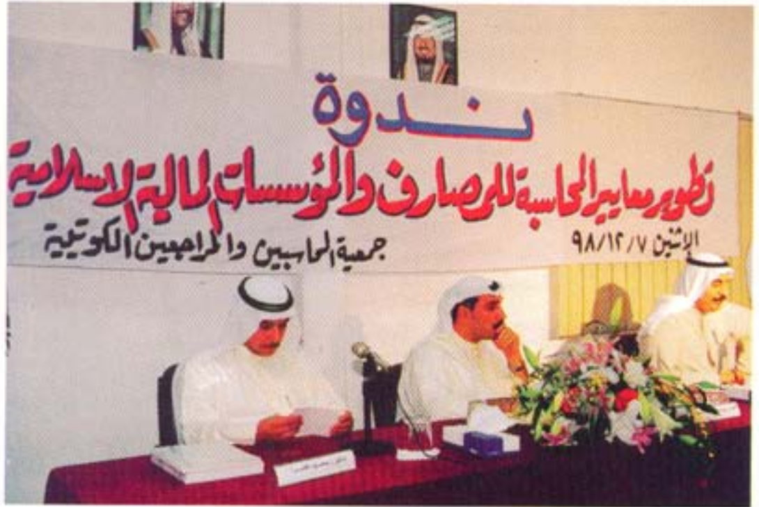
● ندوة الجمعية