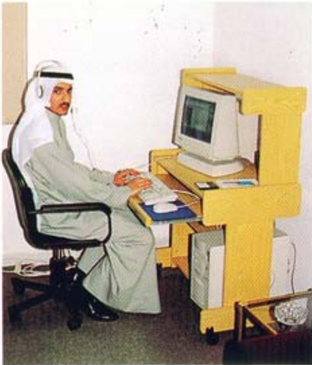
● خدمة الانترنت

قامت الجمعية بادخال خدمة الانترنت بمقرها حتى يتسنى لجميع أعضائها استخدام هذه الخدمة دون أي مقابل أثناء تواجدهم في مقر الجمعية ، كخدمة مقدمة للأعضاء ضمن الخدمات العلمية والمهنية التي تحرص الجمعية على تقديم المزيد منها وتوفير كل ما يستجد بشأنها .