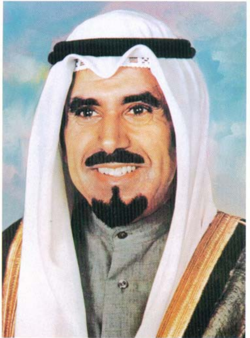
صاحب السمو الشيخ جابر الأحمد الجابر الصباح أمير دولة الكويت