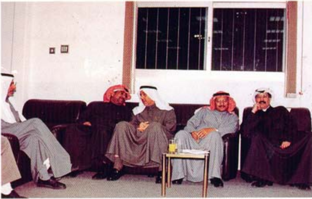
● من حفل العيد

أعضاء الجمعية ، وخير دليل على ذلك هو الحضور الكثيف من قبل الأعضاء بشكل لم يسبق له مثيل في مثل هذه المناسبات .