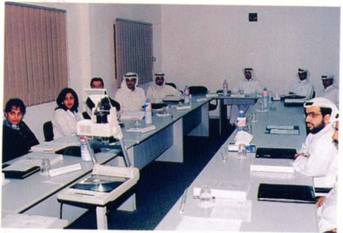
● إحدى الدورات التدريبية

قامت لجنة التدريب من واقع أنشطة تدريبية موسعة بعقد عدة دورات تدريبية وذلك كما يلي :