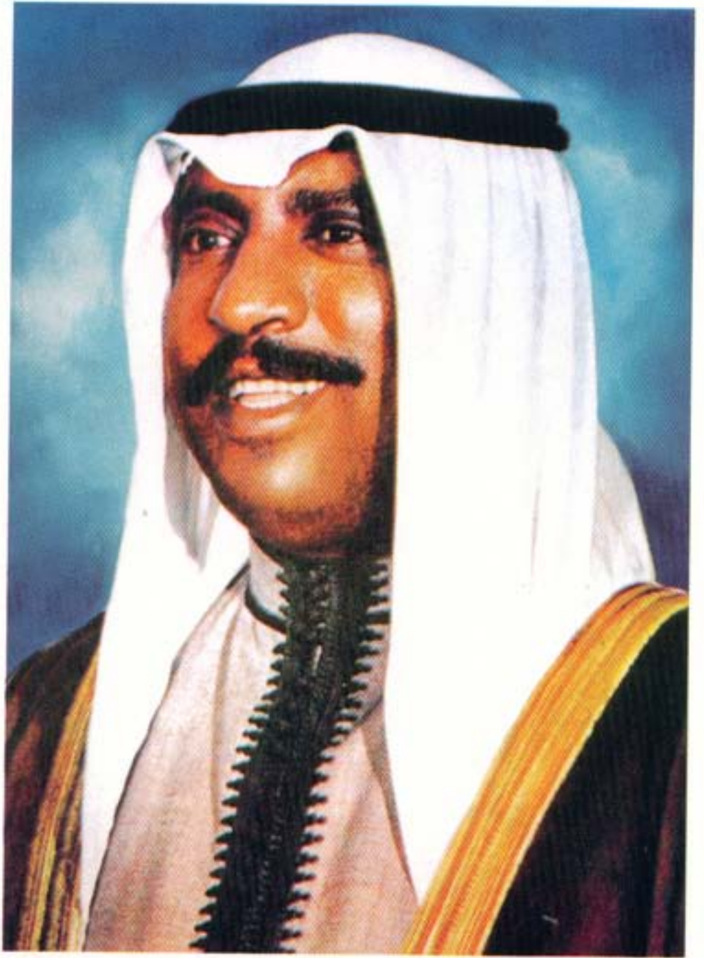
سمو الشيخ سعد العبدالله السالم الصباح ولي العهد ورئيس مجلس الوزراء