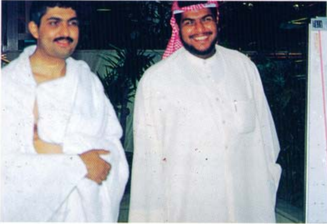
● من رحلة العمرة

ضمن الأنشطة الهامة والعديدة قامت اللجنة الثقافية والاجتماعية بالجمعية بتوفيق من الله سبحانه وتعالى وبإشادة كبيرة من المشاركين بتسيير رحلة العمرة لأعضاء الجمعية ومرافقيهم والذين بلغ عددهم (٨١) مشارك وذلك خلال العشر الأوائل من شهر رمضان المبارك الماضي خلال الفترة من ٢٣ - ٢٥ ديسمبر ١٩٩٨ ، حيث أشاد جميع المشاركين وذلك من واقع الاستبيان الذي تم توزيعه عليهم عند عودتهم من تلك الرحلة بالجهود الحثيثة المبذولة لانجاحها .