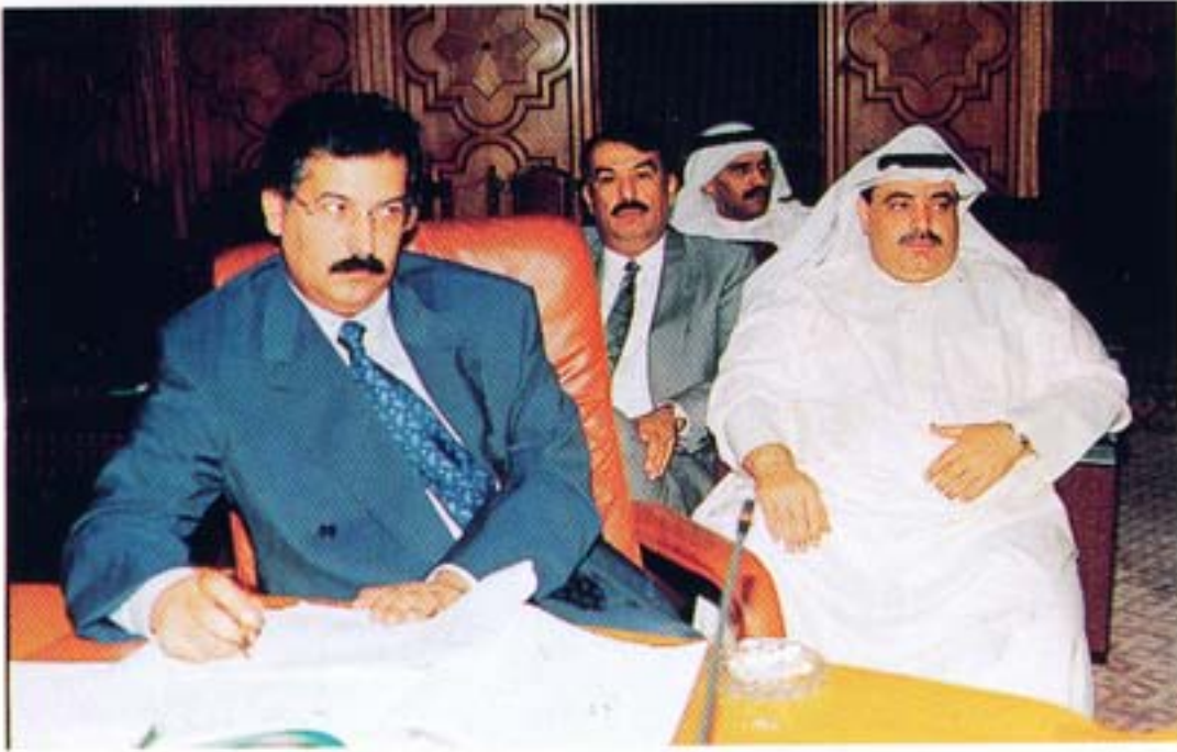
● المشاركون في اجتماع الاتحاد العام للمحاسبين والمراجعين العرب بالقاهرة

الوطن العربي والعمل على تطويرها في ضوء التحديات العالمية المحيطة بالمهنة في ظل اتفاقيات الجات ، ضرورة إعادة صياغة قانون تنظيم مزاولة المهنة في كل الدول العربية من خلال إطار عام ، وضرورة تطوير المناهج الدراسية بالجامعات والمعاهد العلمية بالوطن العربي للتلاءم مع المتغيرات والمستجدات المعاصرة .