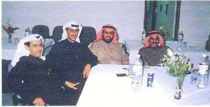
احتفال الجمعية بحلول شهر رمضان المبارك