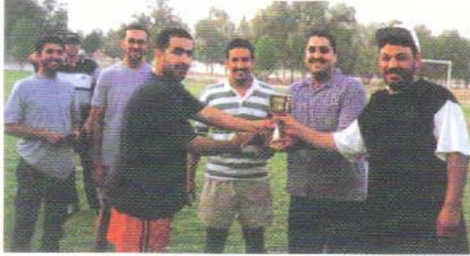
من المسابقات الرياضية التي أقيمت أثناء الرحلة