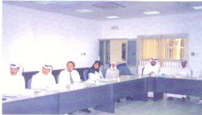
من دورة الـ CPA الأمريكية