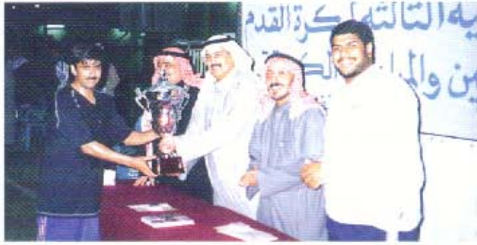
تسليم الكأس للفريق الفائز