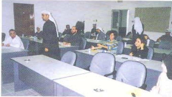
من امتحان شهادة الـ ABA الأمريكية

علماً بأنه بناءً على موافقة مجلس المحاسبة والضريبة الأمريكي على اعتبار الجمعية كجهة للتدريب ومقر لاداء امتحان الشهادة المذكورة، فقد تم عقد الامتحان بمقر الجمعية وذلك يوم الجمعة الموافق ٨ ديسمبر ٢٠٠٠ على فترتين صباحية ومساءلية مدة كل منها أربعة ساعات.