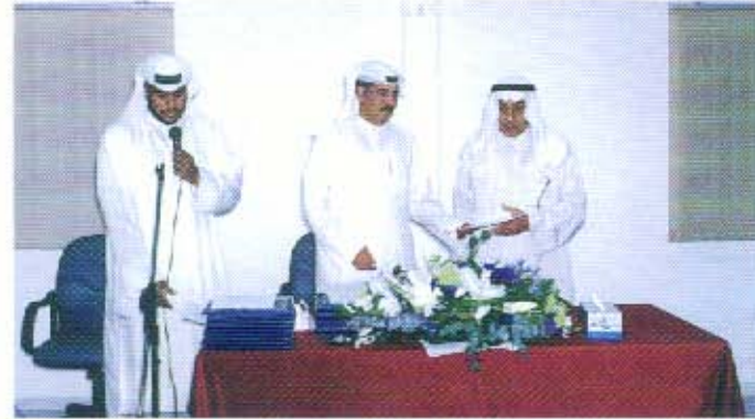
توزيع شهادات الإتحاد وتكريم أعضاء اللجان الفرعية