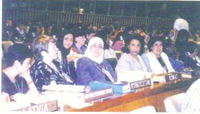
مشاركة الجمعية في مؤتمر «المرأة ٢٠٠٠»، بنيويورك