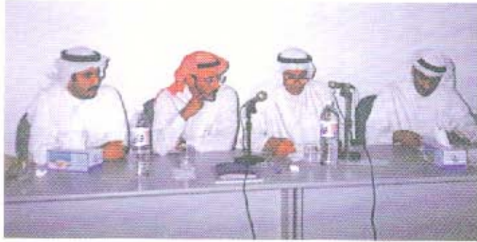
اللجنة المنظمة لعملية الانتخابات تعلن نتائج الفرز