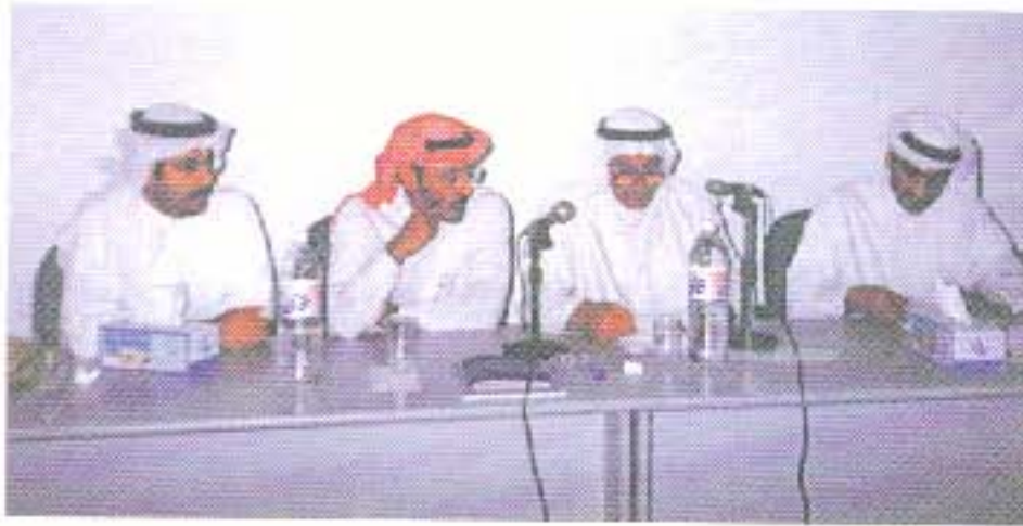
اللجنة المنظمة لعملية الانتخابات تعلن نتائج الفرز

من خلال الجمعية العمومية العادية التي تم عقدها بتاريخ ٢٠٠٠/٤/٣ تم انتخاب ستة اعضاء ممثلين للجمعية في عضوية الجمعية العمومية لهيئة المحاسبة والمراجعة لدول الخليج العربية المنبثقة من الامانة العامة لمجلس التعاون لدول الخليج العربية وذلك وفقا لاحكام النظام الاساسي لهيئة المحاسبة والمراجعة الذي يشترط انتخاب (٦) من اعضاء الجمعية على ان يكون من بينهم على الاقل (٤) مراقبين حسابات ممارسين و(٢) الاخرين يتم اختيارهم وفقا لاعلى الاصوات ايا كان مراقبين حسابات أو محاسبين .