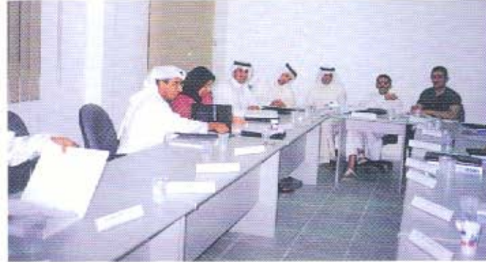
من إحدى الدورات التدريبية

القطاعات العام والخاص خلال الفترة من ٨-١٢ ابريل ٢٠٠٠