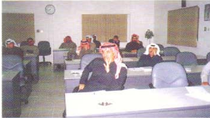
جانب من حضور الدورة التعريفية بالمشروعات الصغيرة