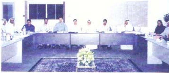
من إحدى الدورات التدريبية

٢- اعداد وتحليل قائمة التدفقات النقدية للقطاعات الاقتصادية المختلفة خلال الفترة من ٢٩ ابريل -٣ مايو ٢٠٠٠