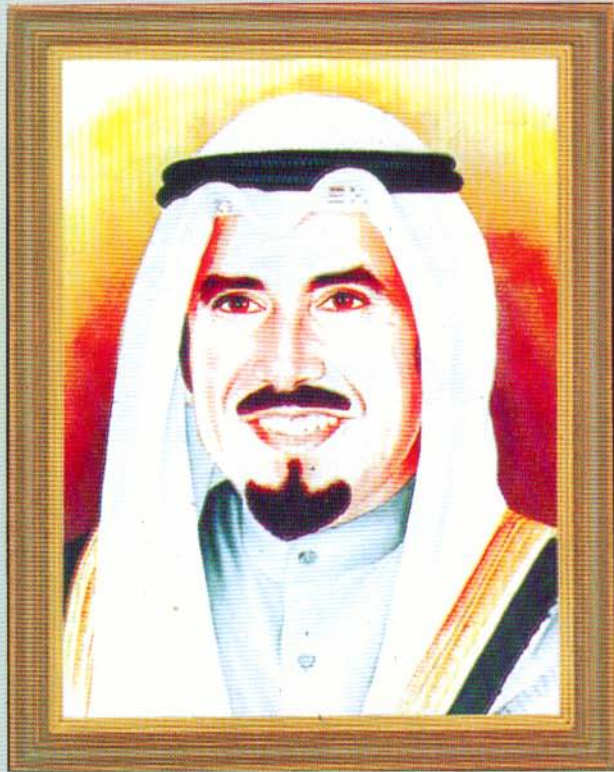
صاحب السمو الشيخ جابر الأحمد الجابر الصباح أمير دولة الكويت