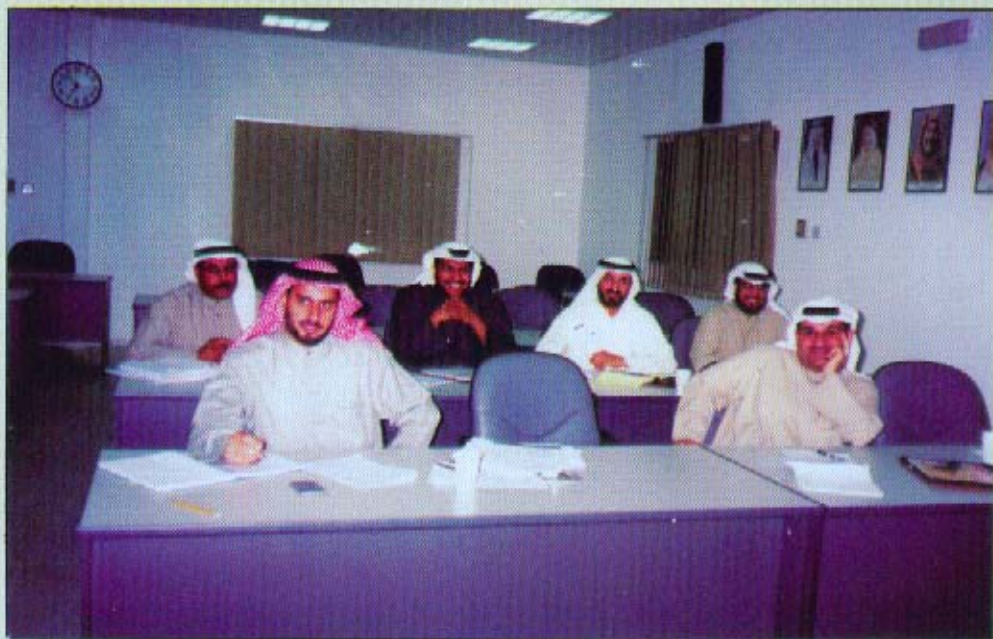
من الدورة التأهيلية الخاصة بإمتحان القيد في سجل مراقبي الحسابات

تم عقد الدورة التأهيلية للراغبين من أعضاء الجمعية في أداء امتحان القيد في سجل مراقبي الحسابات بوزارة التجارة والصناعة خلال الفترة من ٢٠٠١/١٠/١٣ وحتى ٢٠٠١/١٢/١٩ وقد شارك فيها (١٥) مشارك من أعضاء الجمعية ، حيث تتضمن تدريس مواد الامتحان وهي ( المحاسبة المالية - نظرية المحاسبة - محاسبة التكاليف - المراجعة ) ويقوم بتدريسها نخبة من اساتذة الجامعة المتخصصون ، و جدير بالذكر بأن الجمعية حرصت على عقد تلك الدورة بواقع مرتين في العام خدمة لأعضائها الراغبين في أداء امتحان القيد ، كما تقوم بدعم هذه الدورة مادياً حيث تتحمل ٢٥% من قيمة تكلفة الدورة تشجيعاً لأعضائها على المشاركة فيها وكذلك على الانخراط في مجال المهنة.