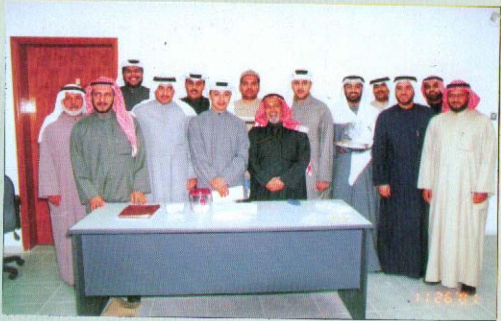
حفلة الغبقة الرمضانية والمسابقة الثقافية الأولى