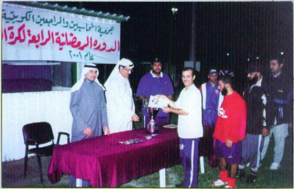
الدورة الرمضانية الرابعة لكرة القدم