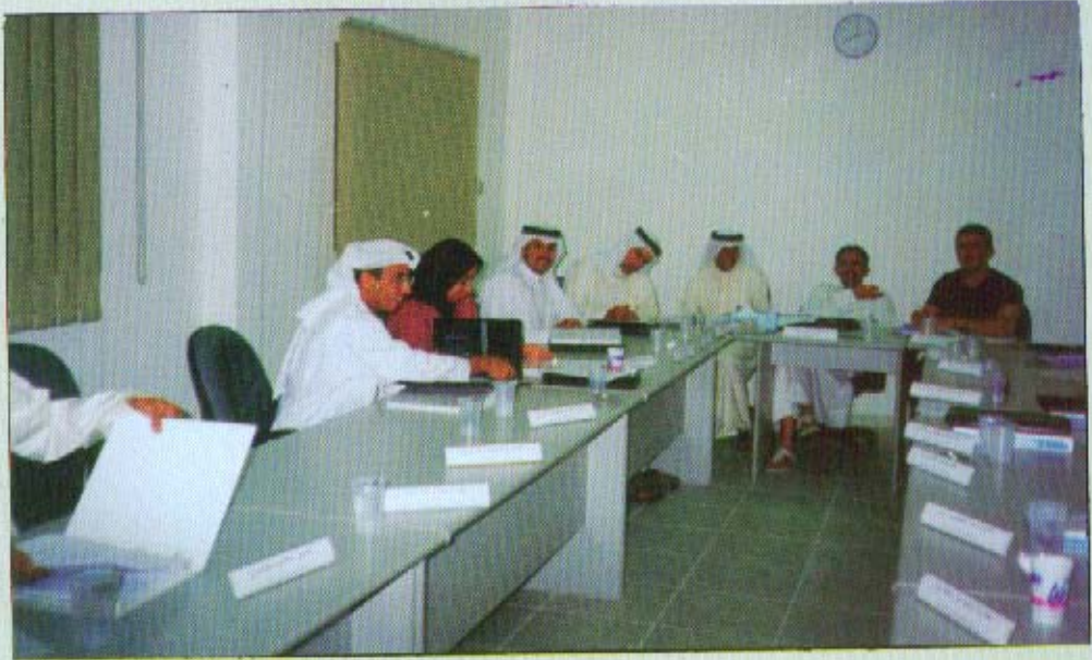
من الدورات التدريبية

وقد شارك في تلك الدورات عدد من المرشحين من الجهات المختلفة في الدولة ، وكذلك بعض أعضاء الجمعية وغيرهم من بعض الأفراد.