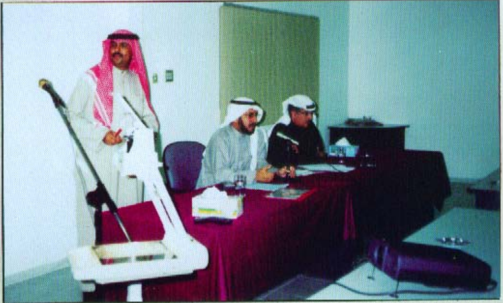
من الحلقة النقاشية حول البرنامج الذي اعتمده الجمعية مؤخراً

والخاصة بمنح بعض الوظائف والمهن بدلات ومكافأة خاصة من بينها على سبيل المثال الوظائف ذات الطابع الفني مثل الأطباء والمهندسين وشاغلي الوظائف ذات الطابع الهندسي ومؤخراً الكادر الجديد للأطباء عدا فئة المحاسبين.