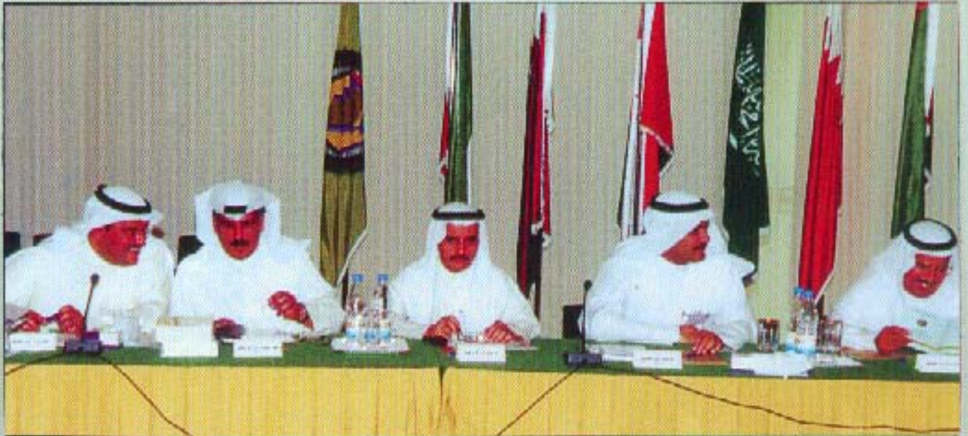
من الإجتماع الأول للجمعية العمومية لهيئة المحاسبة والمراجعة لدول مجلس التعاون لدول الخليج العربية