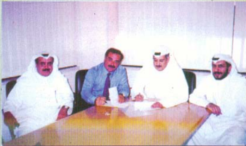
ممثلي مجلس الإدارة ومدير مبيعات طيران الإمارات أثناء توقيع الاتفاقية

تتويجاً لجهود مجلس إدارة الجمعية المستمرة والساعية إلى تقديم المزايا المادية والعينية لأعضاء الجمعية من خلال التنسيق والتعاون مع الشركات التجارية المتخصصة ، ومن منطلق التعاون المثمر بين جمعية المحاسبين والخطوط الجوية الإماراتية - طيران الإمارات (الطيران المثالي لسنة ٢٠٠١م) فقد تم عقد اتفاق بين الجمعية والخطوط الإماراتية لمنح أعضاء الجمعية وعائلاتهم خصماً خاصاً نسبته ١٥% من أسعار الرحلات الاعتيادية لجميع خطوط الرحلات ، بالإضافة إلى منحهم بعض التسهيلات الإضافية منها أولوية تأكيد الحجز والوزن الإضافي وغيرها من الأمور.