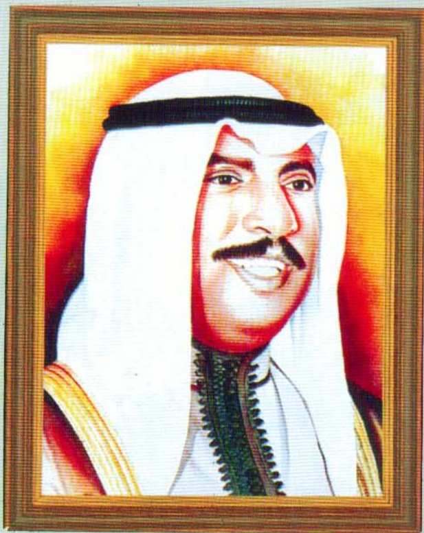
سمو الشيخ سعد العبدالله السالم الصباح ولي العهد ورئيس مجلس الوزراء