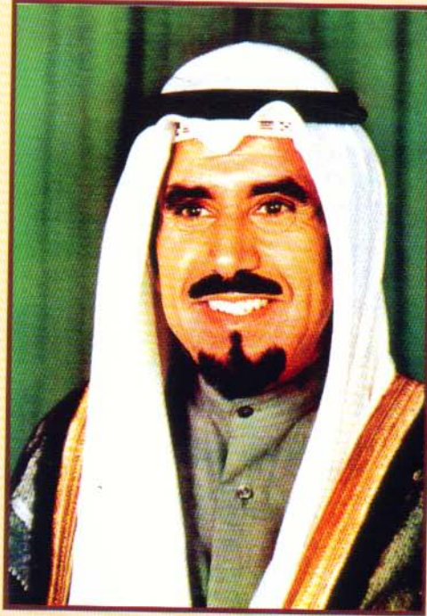
صاحب السمو الشيخ جابر الأحمد الجابر الصباح أمير دولة الكويت