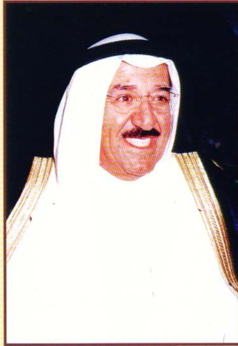
سمو الشيخ صباح الاحمد الجابر الصباح رئيس مجلس الوزراء