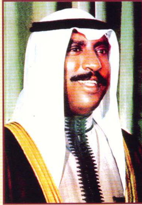
سمو الشيخ سعد العبدالله السالم الصباح ولي العهد