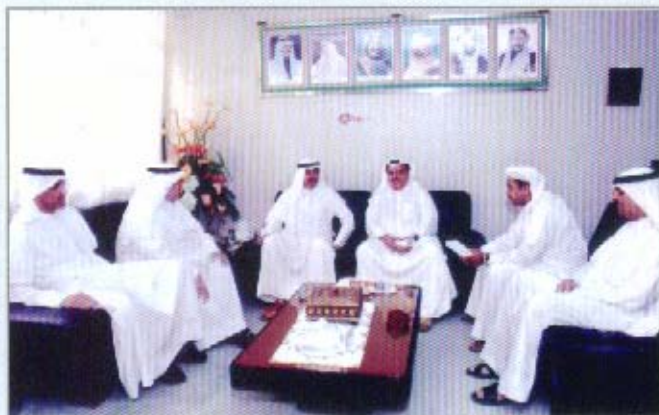
لقاء وزير الشؤون الاجتماعية

الحجي حيث جرى بحث عدد من الموضوعات والمقترحات المقدمة من الجمعية.