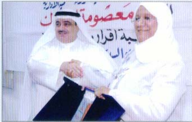
تسليم الدرع لمعالي د. معصومه المبارك

المستوى الاقتصادي والمالي للدولة، والاهتمام بمهنة المحاسبة والمراجعة على المستويات المحلية والإقليمية والدولية لما لها من ارتباط وثيق بالمحافظة على المقدرات الاقتصادية والمالية للدولة، ومساهمتها بشكل أساسي وفعال في تحقيق التنمية الاقتصادية ومن ثم تحقيق التقدم والازدهار للأفراد والمجتمعات.