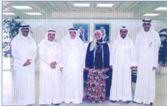
لقاء وزير التخطيط ووزير الدولة لشؤون التنمية الإدارية

تتم مهنة المحاسبة والمراجعة والتي أبدت الجمعية استعدادها لتقديم كافة إمكانياتها العلمية والمهنية بالتعاون مع الوزارة بشأنها بما يعود بالفائدة على الجميع ومنها: