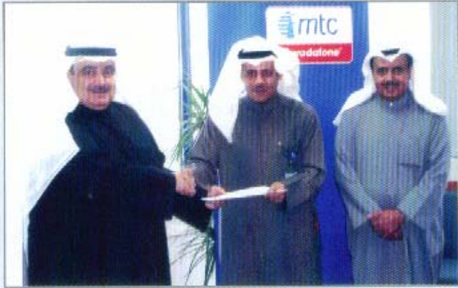
رئيس مجلس ادارة الجمعية يتسلم عقد الاتفاق من المدير التنفيذي للمبيعات بشركة mtc بحضور نائب رئيس مجلس ادارة الجمعية

واحتساب تكلفة مخفضة لسعر الوحدة مع السماح للعضو الحصول على خمسة خطوط بتلك المزايا والخصومات.