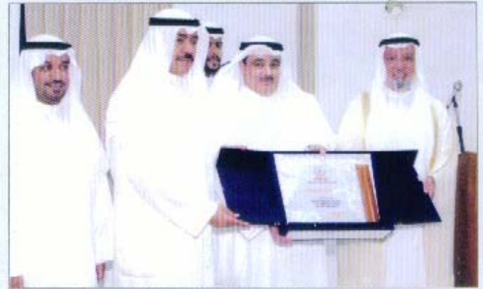
تسليم الدروع لكل من معالي وزير العدل ومعالي وزير الشؤون الاجتماعية والعمل

مساندتهم الكبيرة أثناء عرض مطالبة الجمعية بتلك البدلات على الجهات التشريعية والتنفيذية في الدولة.