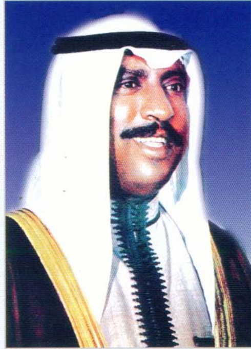
صاحب السمو الأمير الوالد