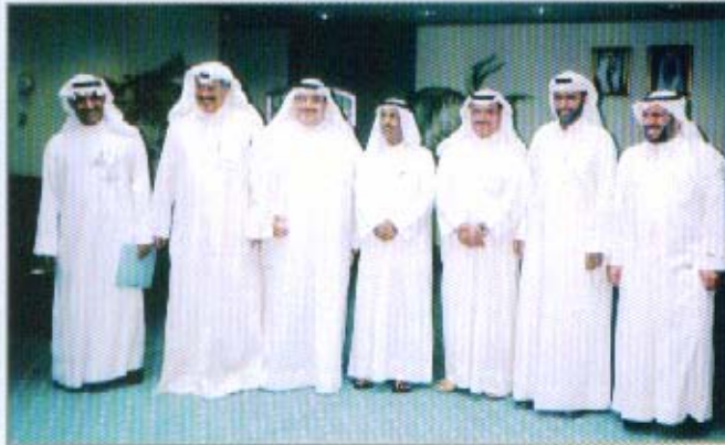
لقاء رئيس ديوان المحاسبة

قام وفد من مجلس إدارة الجمعية بزيارة لديوان المحاسبة التقى خلالها بمعالي رئيس الديوان السيد/ براك خالد المرزوق، وتم بحث عدد من الموضوعات المتعلقة بمهنة المحاسبة والمراجعة. حيث أوضح رئيس مجلس إدارة الجمعية خلال