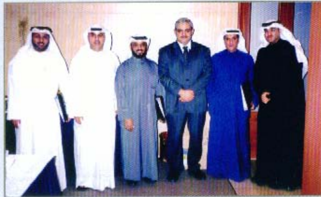
بعض المشاركين بورشة العمل

عنوان "تنمية مهارات التنبؤ والتخطيط المالي في الوحدات الحكومية باستخدام الحاسب الآلي"، حيث تم عقدها بفندق جي دبليو ماريوت بتاريخ ٢٠٠٥/١١/٢١ وقد شارك فيها (٩) مشاركين، متضمنة التخطيط الاستراتيجي وصياغة الأهداف عند اعداد الموازنات، مهارات اعداد الموازنات طبقا للاتجاهات الحديثة باستخدام