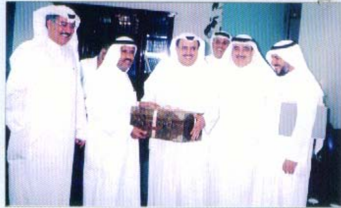
لقاء رئيس ديوان المحاسبة

ومن جانبه أكد رئيس ديوان المحاسبة على دعم الديوان لمساعي الجمعية في سبيل دعم وتعزيز مهنة المحاسبة والمراجعة واستمرار التواصل وتبادل الخبرات العلمية والمهنية عن طريق تبادل اللقاءات والزيارات بين المسؤولين في الجانبين، كما عبر عن استعداد الديوان لتقديم كافة التسهيلات والامكانات لجمعية المحاسبين خاصة