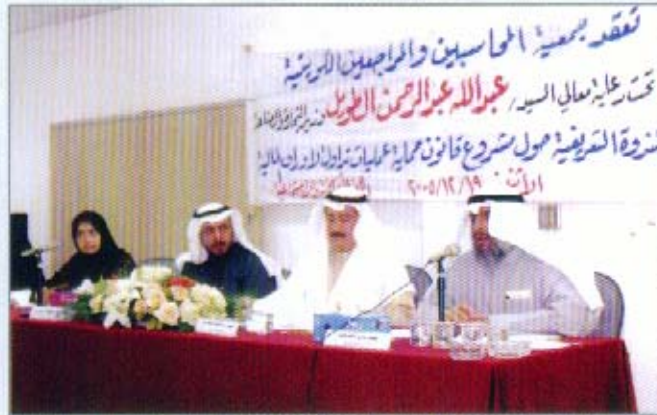
الندوة التعريفية حول مشروع قانون حماية عمليات تداول الأوراق المالية

تحت رعاية معالي وزير التجارة والصناعة السيد/ عبدالله عبدالرحمن الطويل عقدت اللجنة الثقافية والاجتماعية بالجمعية يوم الاثنين الموافق ٢٠٠٥/١٢/١٩ ندوة "مشروع قانون حماية