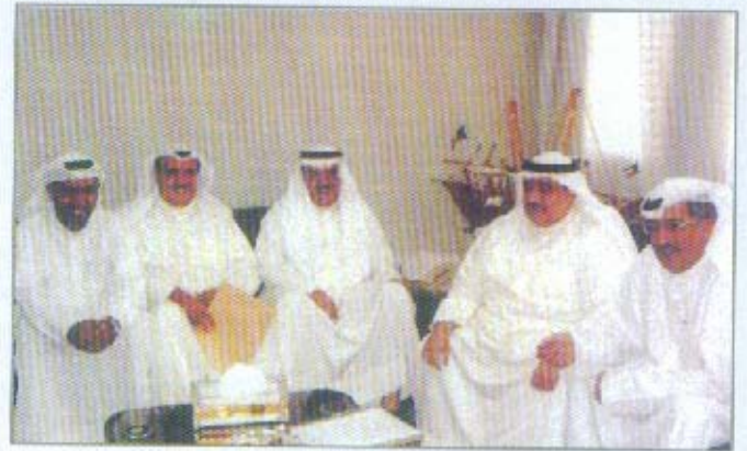
لقاء معالي وزير التجارة والصناعة

- تحديث ميثاق شرف المهنة وفق المستجدات الحالية عبر لجنة مشتركة من الوزارة والجمعية.