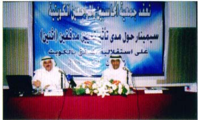
ندوة حول مدى تأثير تعيين مدققين (اثنين) على استقلالية المدقق بالكويت

نظمت الجمعية ندوة حول مدى تأثير تعيين مدققين (اثنين) على استقلالية المدقق بالكويت يوم الاثنين الموافق ٢٠٠٦/٩/١١ حيث ناقشت التأثيرات الإيجابية لإقرار قانون تعيين عدد اثنين