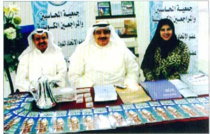
معرض الوظائف بجامعة الخليج

شاركت الجمعية في أعمال وفعاليات معرض الوظائف الذي أقامته جامعة الخليج للعلوم والتكنولوجيا خلال شهر أبريل ٢٠٠٦ وخلال