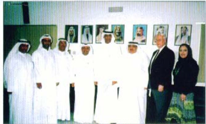
صورة من اللقاء

بمهنة المحاسبة والمراجعة، وبناءً على ذلك فقد قام مجلس الإدارة لاحقاً باستلام مشروع القانون فيما يخص المواد المتعلقة بالشؤون المحاسبية والمهنية وقد تم إجراء التعديلات التي رأتها الجمعية وإبداء التصور النهائي بشأنها وإرسالها إلى رئيسة الفريق وتم اعتماد ما أقرته الجمعية من تعديلات مهنية.