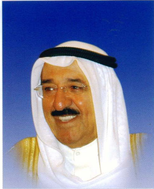
صاحب السمو الشيخ/ صباح الأحمد الجابر الصباح أمير دولة الكويت