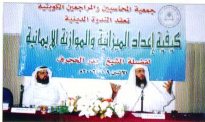
الشيخ / بدر الحجرف يحاضر في الندوة