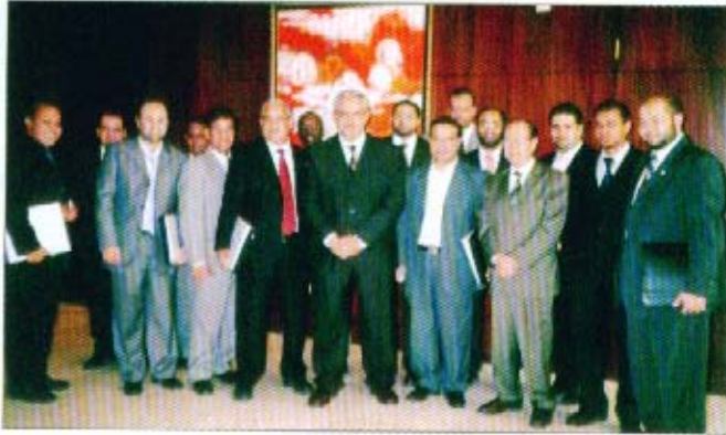
المشاركين في السيمينار

تم عقد معايير المحاسبة الدولية في القطاع الحكومي (القطاع الغير هادف للربح) خلال الفترة من ٢٠ - ٢١/٣/٢٠٠٦ بأحد فنادق الدرجة