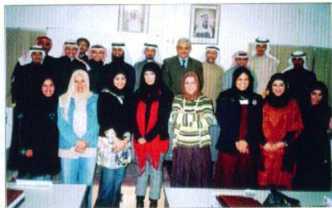
المشاركون في الدورة التدريبية

بإعداد البرنامج التدريبي للموسم ٢٠٠٧/٢٠٠٦ متضمناً عدد (٨) دورات تدريبية متنوعة في مجال المحاسبة والمراجعة ودراسات الجدوى تستمر حتى تاريخ انتهاء انعقادها المقرر في ٢٠٠٧/٥/١٦ متضمنة ما يلي: