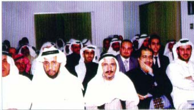
جانب من المشاركين في ندوة هيئة أسواق المال

إنشاء هيئة أسواق المال وشرح التصورين المقدمين حول المشروع من كل من فريق دراسة مشروع أسواق المال (وزارة التجارة والصناعة) ولجنة سوق الكويت للأوراق المالية السابقة واستعراض ما تضمن كل تصور منهما، وتم طرح العديد من وجهات النظر حول هذا الموضوع، كما تم التأكيد على أهمية تنظيم سوق الكويت وذلك بإصدار هذا التشريع المطلوب.