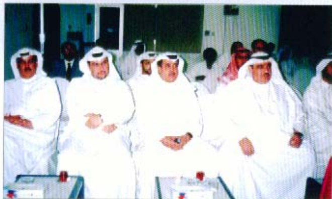
جانب من الحضور في الندوة الرمضانية

أقامت الجمعية يوم الاثنين الموافق ٢٠٠٦/١٠/٩ ندوة بعنوان (كيفية إعداد الميزانية والموازنة الإيمانية) لفضيلة الشيخ بدر الحجرف، حيث حضرها عدد كبير من أعضاء الجمعية وهي إحدى الأنشطة الرمضانية التي تساهم مساهمة فعالة في توطيد العلاقات بين الأعضاء.