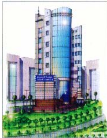
مبنى الجمعية الجديد المزمع إنشاؤه

بمهنة المحاسبة والمراجعة، وبناءً على ذلك فقد قام مجلس الإدارة لاحقاً باستلام مشروع القانون فيما يخص المواد المتعلقة بالشؤون المحاسبية والمهنية وقد تم إجراء التعديلات التي رأتها الجمعية وإبداء التصور النهائي بشأنها وإرسالها إلى رئيسة الفريق وتم اعتماد ما أقرته الجمعية من تعديلات مهنية.