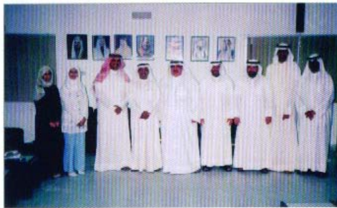
الاجتماع التشاوري بين مجلس إدارة الجمعية ووزارة التجارة والصناعة

العمل بما جاء بقواعد السلوك الأخلاقي للمحاسبين المهنيين الصادرة عن الاتحاد الدولي للمحاسبين على مراقبي الحسابات المقيدون في سجل مراقبي الحسابات بوزارة التجارة والصناعة، وجاري التنسيق بين الوزارة والجمعية بشأن تحديد آلية العمل لتطبيق القرار الوزاري المشار إليه.