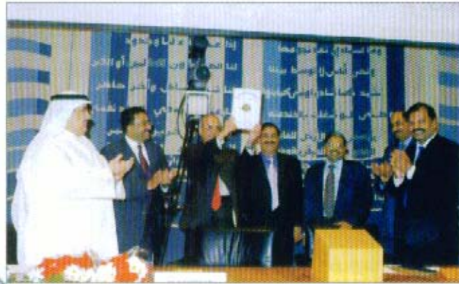
مشاركة الجمعية في اللقاء المهني لأعضاء جمعية المحاسبين القانونيين الهندية

حيث تناول اللقاء طرح التعاون والتواصل بينهم وبين جمعية المحاسبين والمراجعين الكويتية في المجالات المهنية المتنوعة.