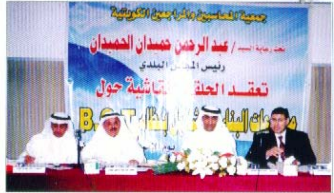
المحاضرون في الندوة B.O.T