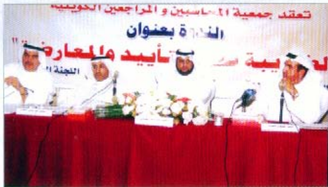
الحاضرون في الندوة الضريبية بين التأييد والمعارضة