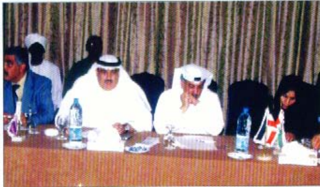
جانب من حضور الاجتماع المنعقد في مدينة عمان بالأردن

شاركت الجمعية في اجتماع الاتحاد العام للمحاسبين والمراجعين العرب وكذلك المؤتمر العلمي الدولي السابع "القيمة العادلة والإبلاغ