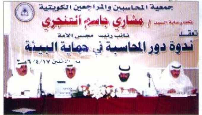
المحاضرون في ندوة دور المحاسبة في حماية البيئة