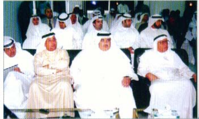
جانب من الحضور في الندوة الضريبية بين التأييد والمعارضة