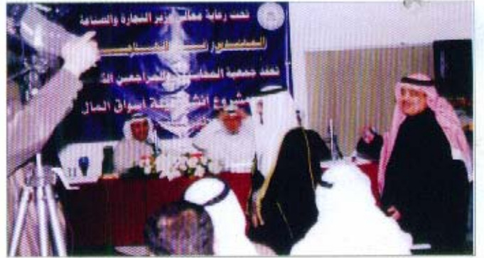
وزير التجارة والصناعة المهندس/ فلاح الهاجري يشارك في الندوة