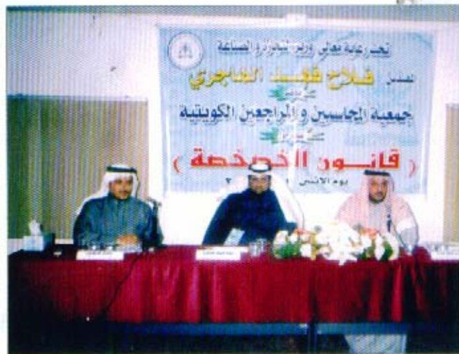
ندوة حول قانون الخصخصة

رئيس اللجنة الاقتصادية والمالية بمجلس الأمة