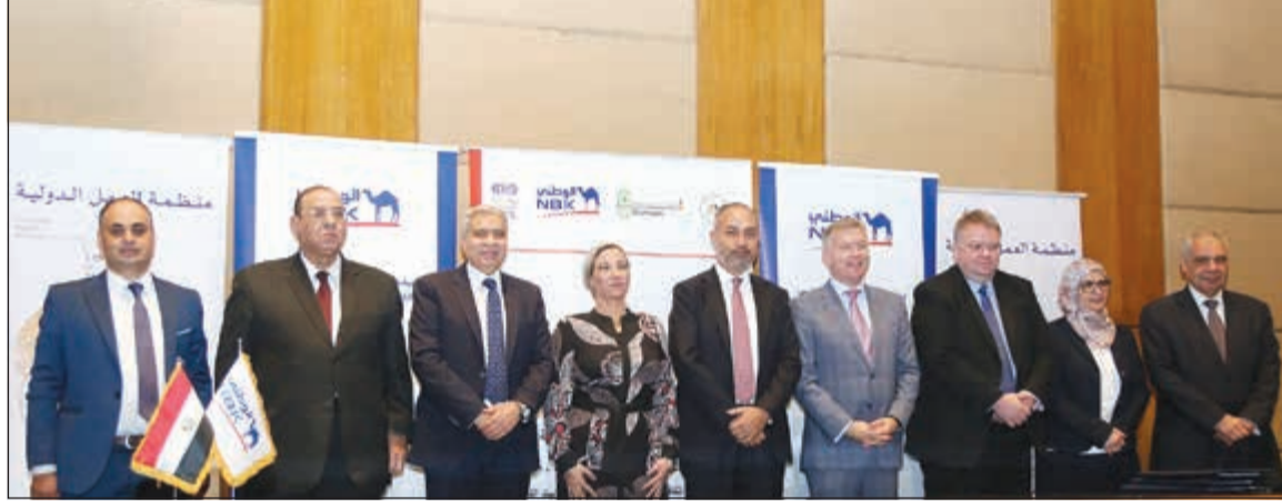
لقطة جماعية بعد توقيع الاتفاقية ويبدو ياسر الطيب

الطيب: نسعى لعقد شراكات مع المجتمع الدولي في إطار دعمنا لتنفيذ رؤية مصر 2030